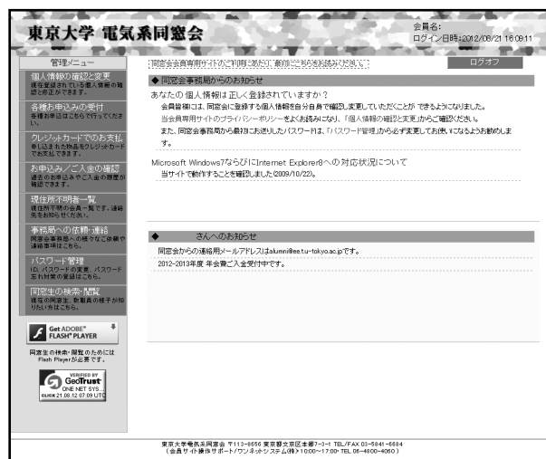
▲同窓会名簿システムメニュー画面